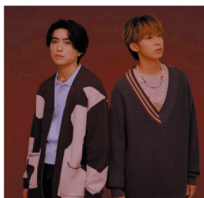
14 SAT D.Y.T