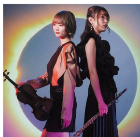
15 SUN はんぶんこ