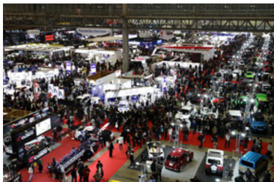
TOKYO AUTO SALON 2020会場風景

皆さまに安心してご来場いただけるよう、国や県、会場の幕張メッセが定める新型コロナウイルス感染拡大防止ガイドラインに基づき、主催者として様々な対策に全力を挙げて取り組んでまいります。