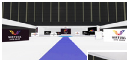
バーチャルオートサロンイメージ