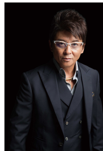
東京オートサロン 2017 アンバサダー 哀川 翔