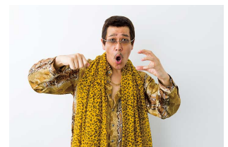
スペシャルゲスト ピコ太郎