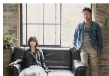
Do As Infinity ▶1.13(fri)